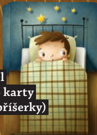
Postel (rub karty příšerky)